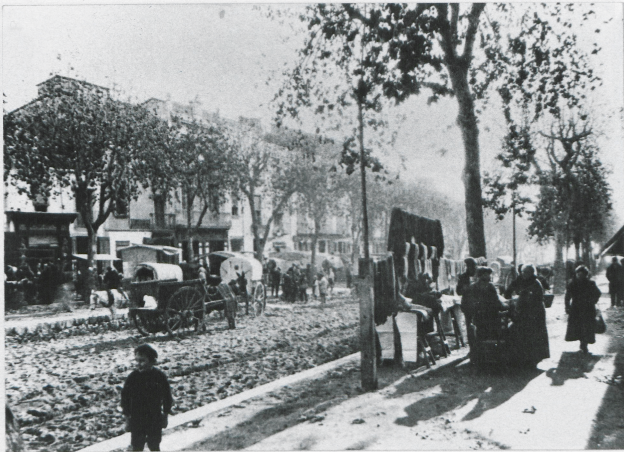
El mercat a la Riera el 1920. És un dia assolellat d'hivern: el sol, baix, -la foto es gairebé un contra-llum- produeix unes ombres allargassades de les persones de la vorera, encara sense les lloses de pedra, i destaca les marques de les petjades sobre la sorra de la Riera. Els carruatges, parats -que no aparcats-, esperen la tornada de l'amo, que ha baixat la verdura de l'hort per a la seva venda, o del que ha vingut amb tartana a comprar-se una gorra, una faixa o bé, simplement a fer petar la xerrada.