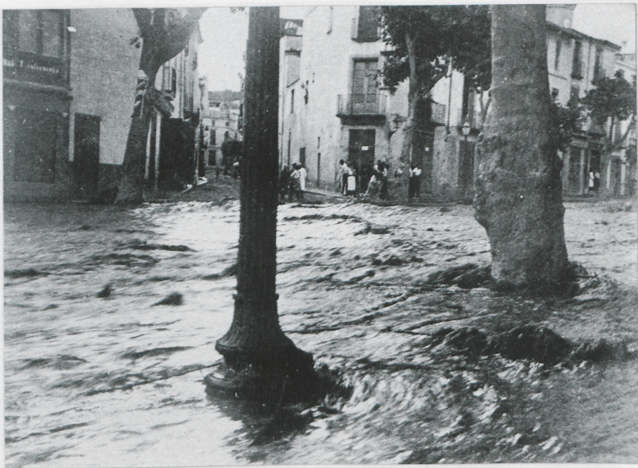
L'espectacle per excel·lència de la Riera: la rierada. Sobretot en la confluència Riera / rial. Aquesta rierada del 1934, va pujar evidentment, perillosament, sobre la vorera.