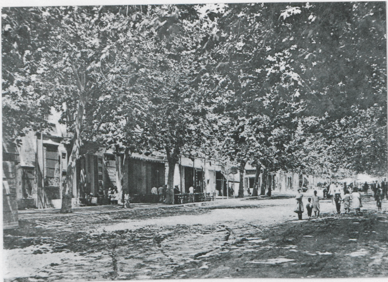
L'alt brancatge de la foto anterior, permetia que, a l'estiu el fullatge cobris tota la part central de la Riera, com es veu en la foto de 1915. S'aprecia molt bé el llit de sorra, i la carretera a Arenys de Munt i a Sant Celoni, sembla encara sense asfaltar. 1915.