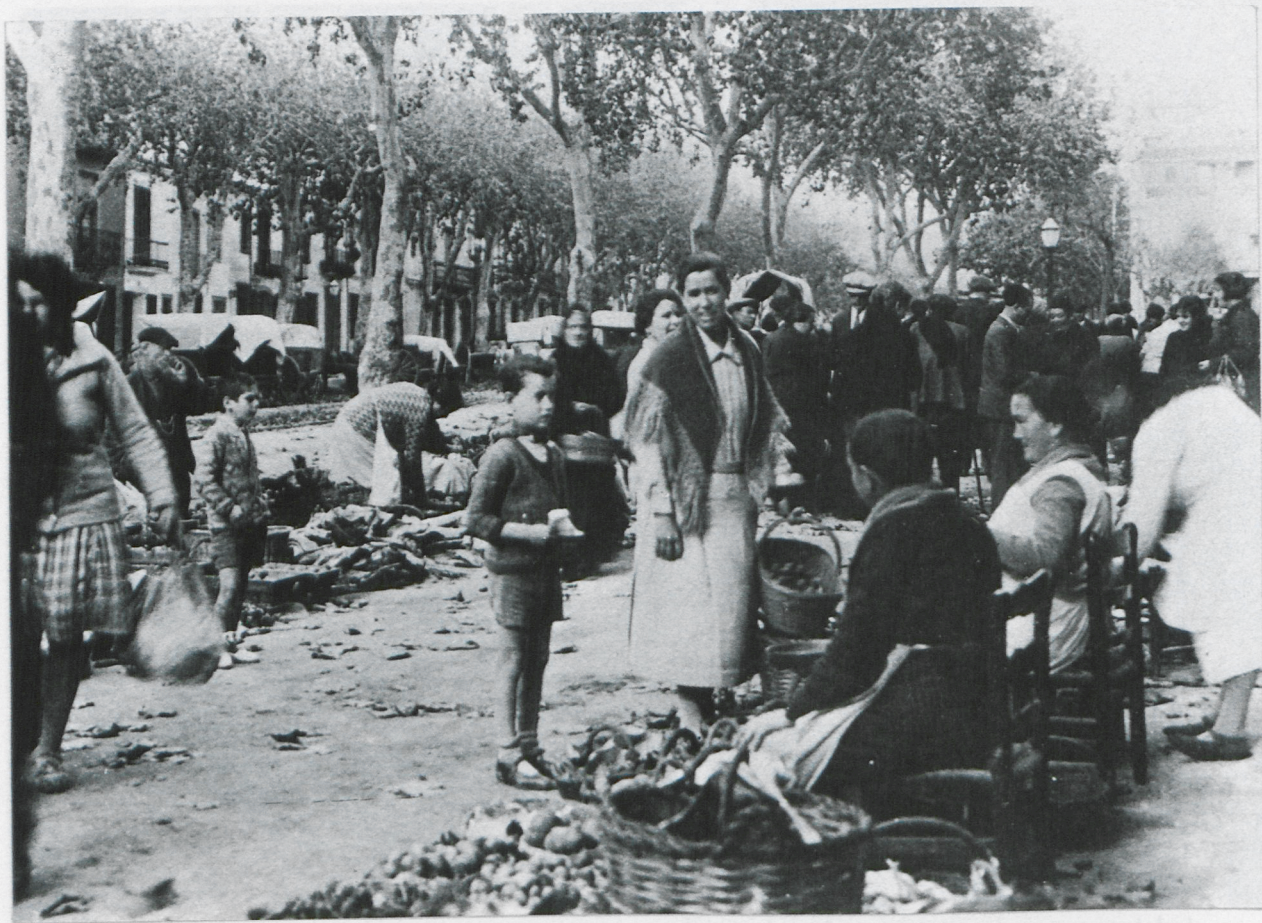
Un altre aspecte del mercat exterior. Les pageses, assegudes en cadires baixes de valca, ofereixen la seva mercaderia—cols, enciams, mongetes—i també la seva conversa. Els homes, agrupats, apart, parlen de les seves coses. 1930.