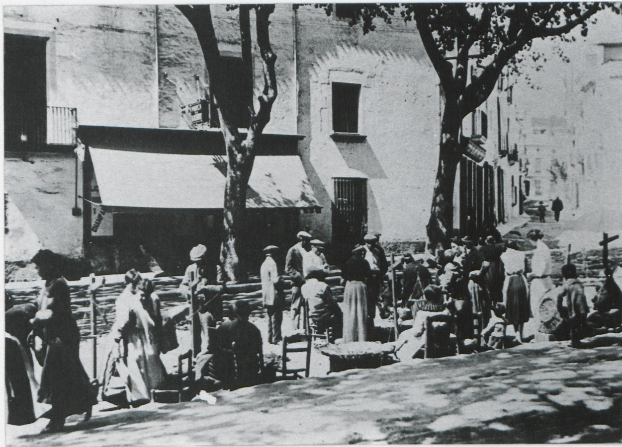
El mercat del peix, a la confluència del Rial amb la Riera, El peix ha arribat recentment pescat, a l'art i al palangre, i és ofert a ple sol al mig de la Riera. 1916.