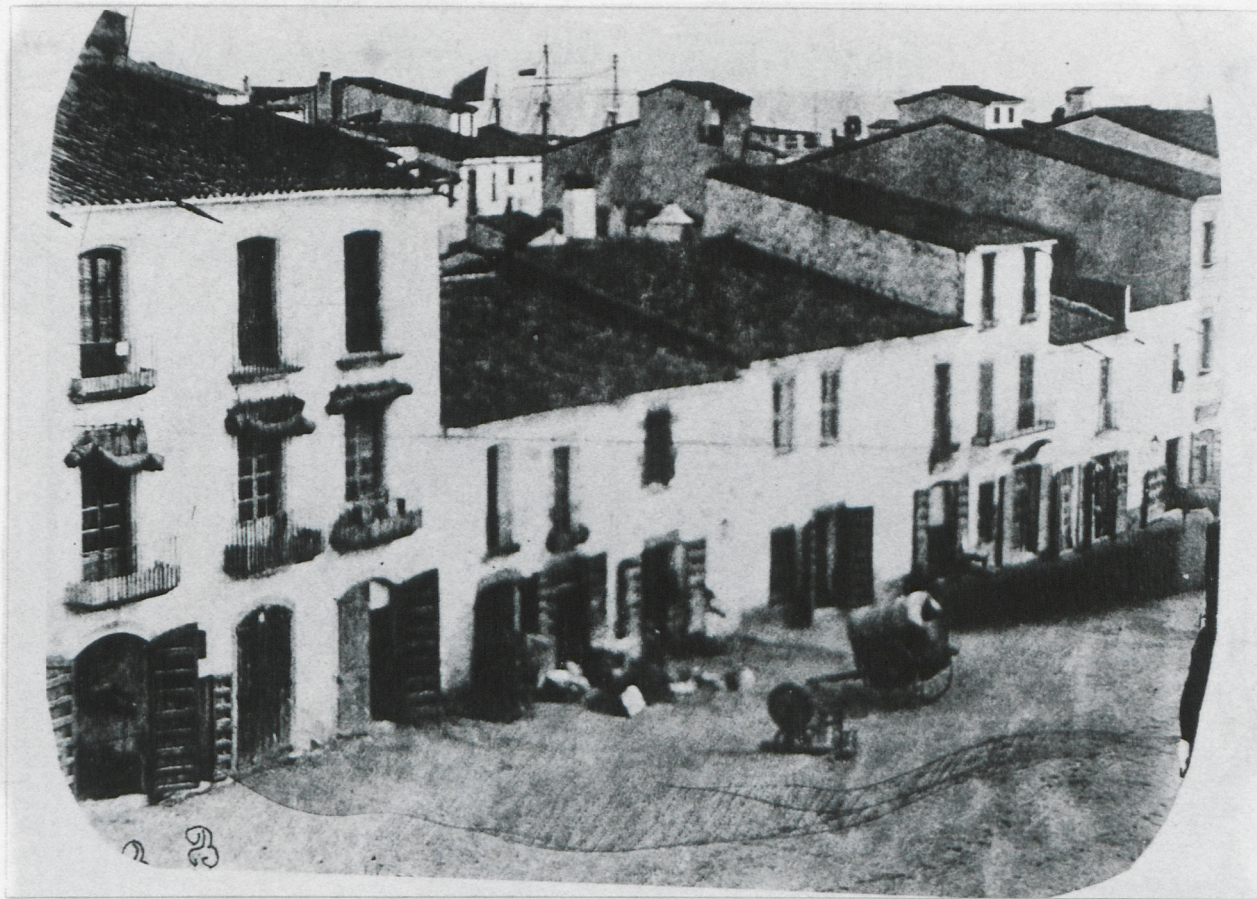
La foto més antiga d'Arenys, del 1865. Pel damunt de les teulades de les cases de la Riera – a l'extrem dret, can Montmany –, encara sense les voravies ni evidentment, els plàtans, sobresurten els pals d'un bergantí en construcció. (Centre superior de la foto). Les drassanes, com es veu clarament per la situació dels pals, estaven situades en els terrenys de l'actual quarter de la guàrdia civil.