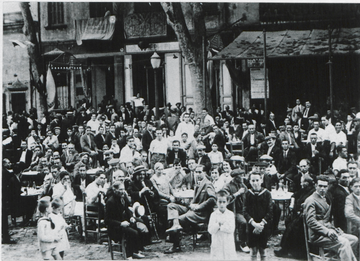
El cafè de can «Milio» el 1925 un dia de festa. Gent endiumenjada constitueixen l'espectacle que el fotògraf enregistra, a la vegada que aquest rep també totes les mirades, obviament complagudes, de tota la concurrència.